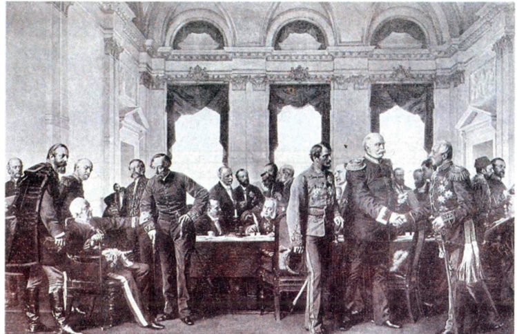
Berlin Konferansı, 1877

İngiltere, Fransa ve Almanya'da 19. asrın yarısına doğru zorunlu ve sosyal birçok sebepler dolayısıyla sanayi işçilerine ve bunların kurdukları sendikalarla başka bir deyişle sendikal hareketlere bazı tavizler vermek zorunda kaldıkları bilinmektedir. Bu tavizin maliyetini müdahale hadleriyle başka ülkelere ödetmek yoluna gitmişler ve bu sayede büyük başarı göstererek sosyal politika ve sosyal ekonominin, işçileri ekonomik ve sosyal yönden korumanın, kurucusu ve uygulayıcısı memleketler olarak da kendi kendilerine kazandırdıkları