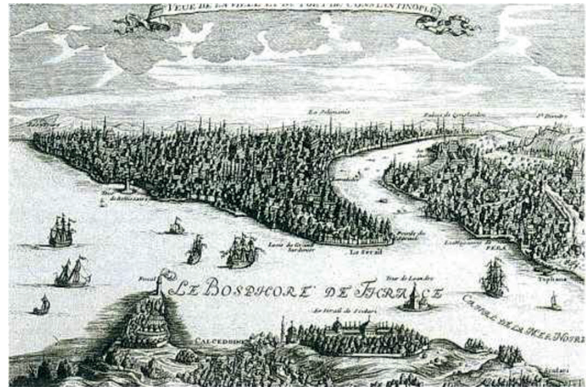
Istanbul gravürü, 1670

Fakat Osmanlı merkantilizmi adını vereceğimiz bu hareketin sanayileşmeyi önlediği öne sürülemez. Sanayileşmeyi önleyen dış ve iç sebepler vardır ve bunları sırayla ele almak gerekir.